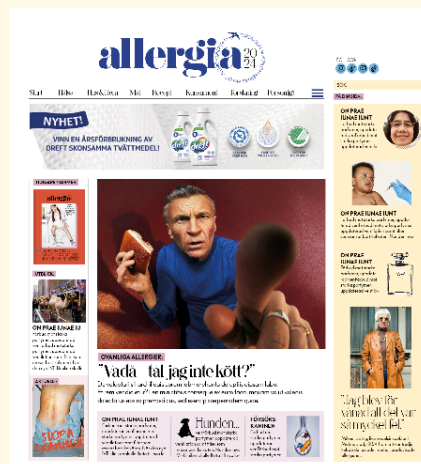
OBS! BILDERNA HÄR ÄR ENDAST SKISSER OCH INTE FÄRDIG/ PUBLICERAT MATERIAL